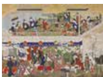
喜多川歌麿(吉原の花)寛政5年(1793)頃 ワズワース・アテナウム美術館